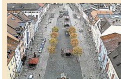
So sah es am Sonntag um 10.45 Uhr in Deggendorf aus.