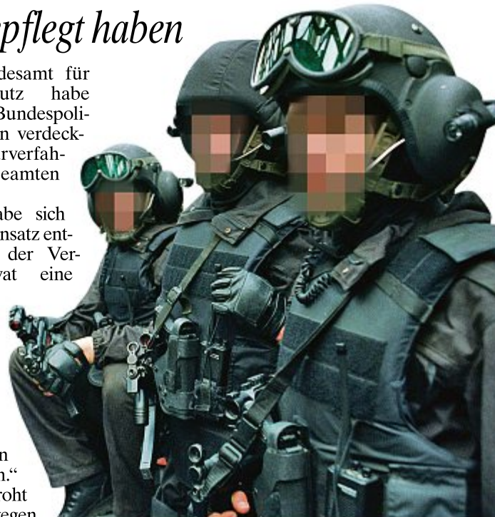
Die GSG 9 ist die Eliteeinheit der Bundespolizei

Focus . Auch soll der Beamte laut Spiegel Kontakte zu Rechtsextremisten der Gruppe „Europäische Aktion“ unterhalten, die von einem Schweizer Holocaust-Leugner angeführt werde. Nach dem Hinweis