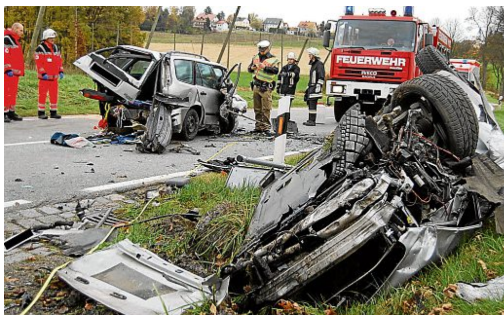
Wie durch ein Wunder nur leicht verletzt wurde der Fahrer des total zerstörten Audi (vorne). Der Fiat-Fahrer dagegen wurde im Wrack seines Wagens eingeklemmt und musste mit dem Rettungshubschrauber ins Schwabinger Klinikum transportiert werden.

gesperrt. Im Einsatz waren gestern Vormittag die Feuerwehren Nandlstadt und Attenkirchen mit zehn Mann und zwei Fahrzeugen. hob