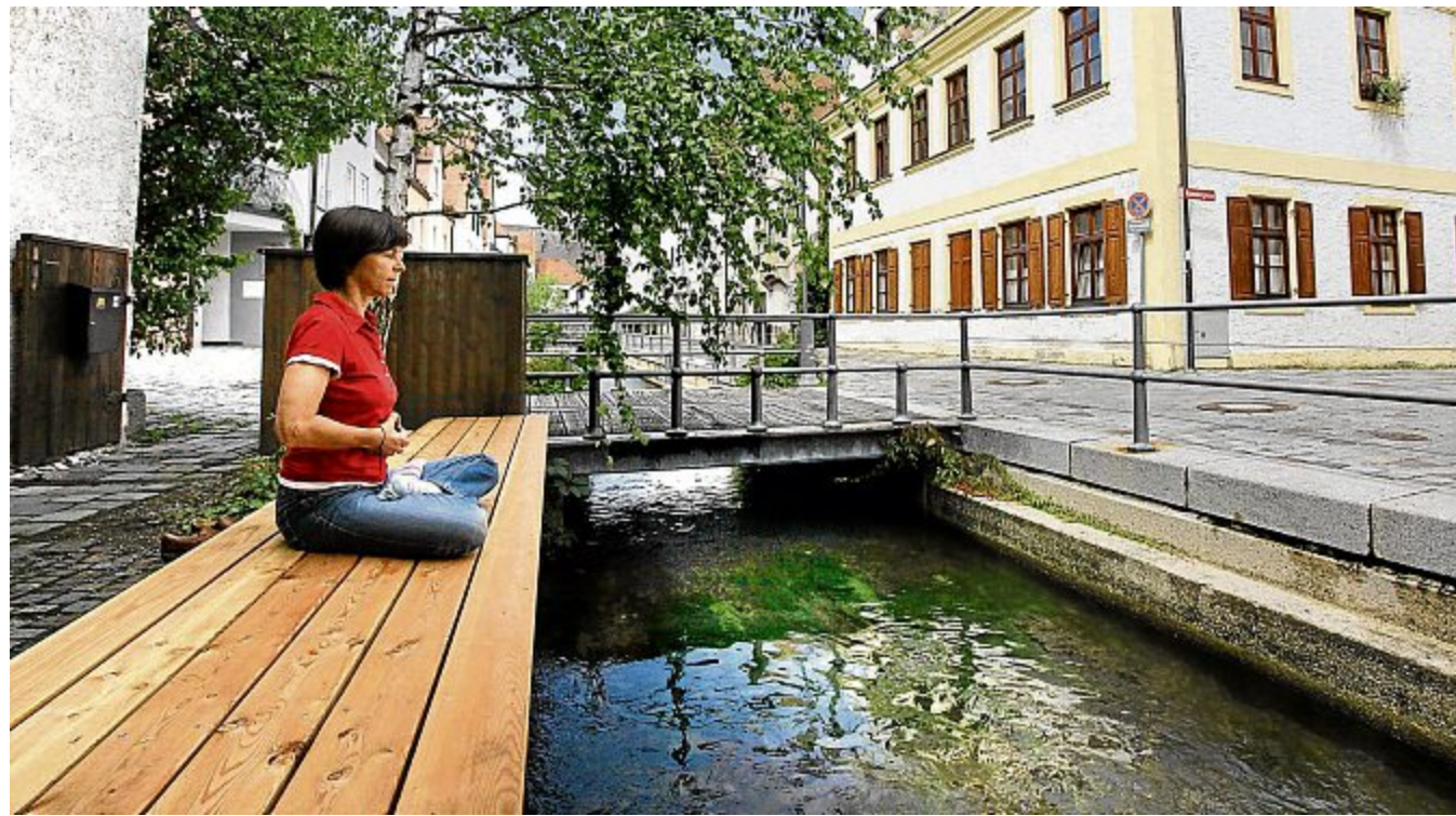
Die Oase der Ruhe an der Fischergasse, die mit einer Meditationsbank alle Freisinger einlädt, ist gefährdet. Die Mönche, die auf Spenden angewiesen sind, müssen 9000 Euro Stellplatzabläse zahlen.