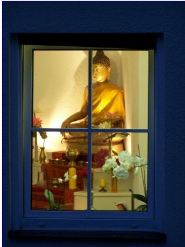
Ende der Regenzeit in Freising